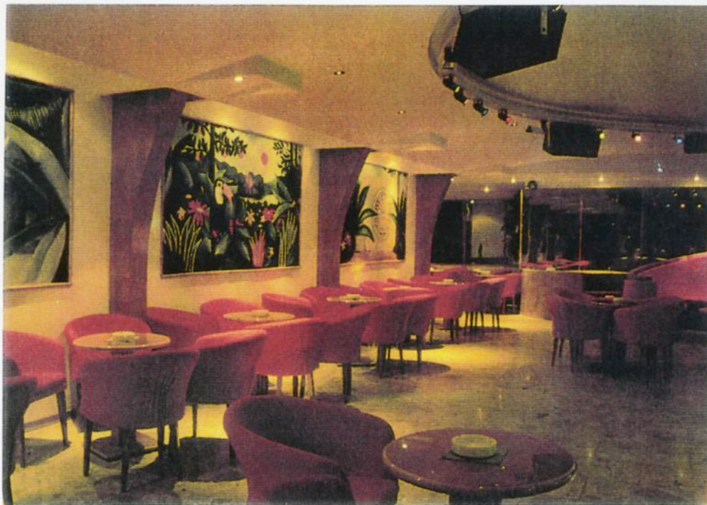
Pad. D Stand 3

il tutto fino al completamento dell'opera, così da liberare il cliente da ogni onere organiz-