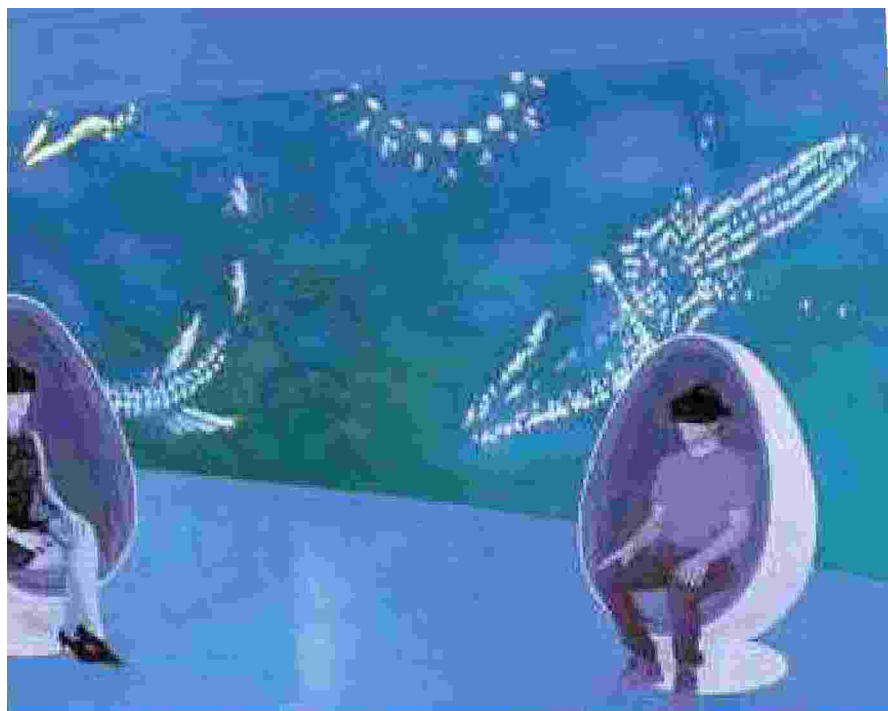
Ricostruzioni al computer della nuova veste dell'Acquario. Da sinistra: la grotta delle murene, le postazioni hi tech e il palombaro virtuale